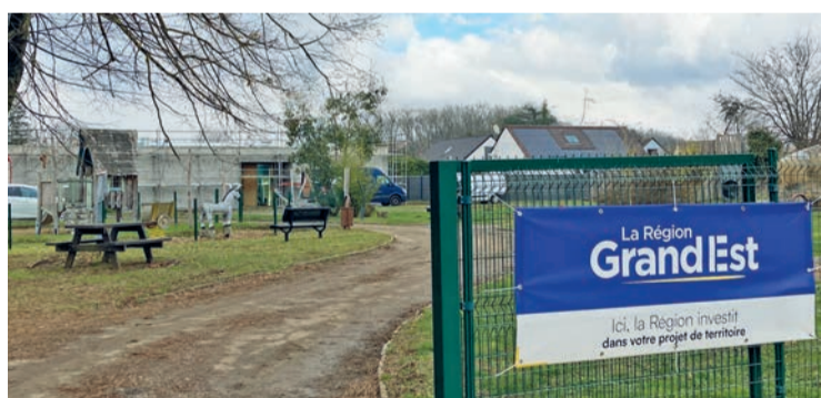
La construction du péricolaire Freinet progresse

Parce que la jeunesse représente l'avenir, accompagner les jeunes Marliens vers l'autonomie, la